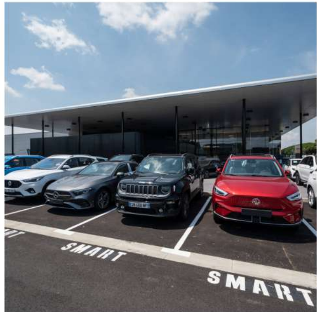
Concession automobiles 84 - Vaucluse