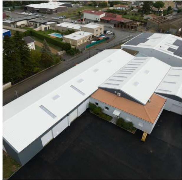
Bâtiment industriel 26 - Drôme