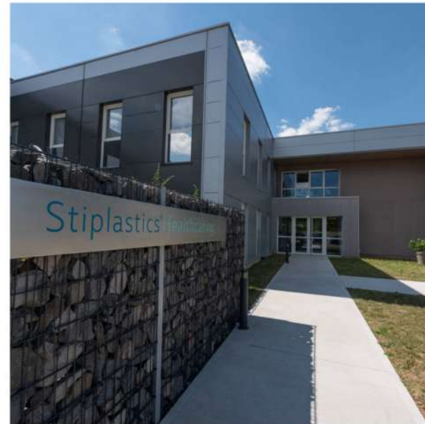
Bâtiment industriel 38 - Isère