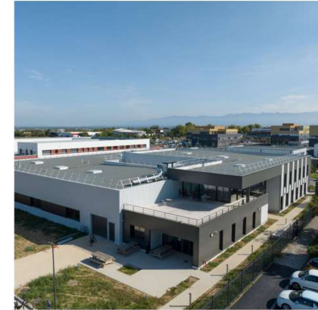
Bâtiment d'activité 26 - Drôme