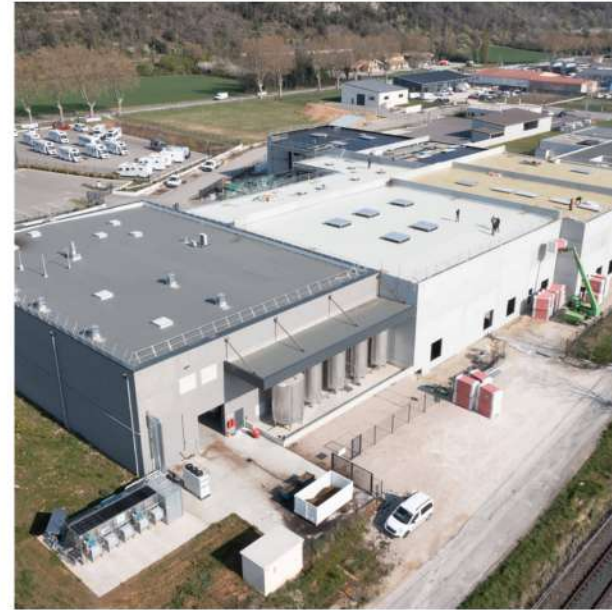
Bâtiment industriel 07 - Ardèche