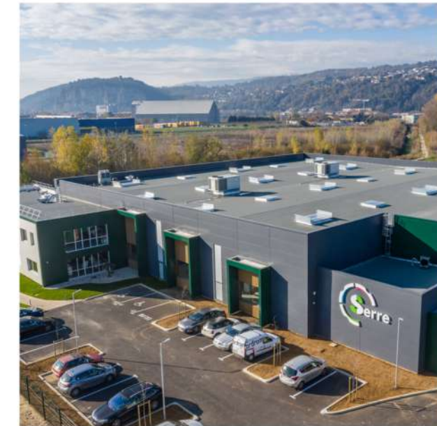
Bâtiment industriel 26 - Drôme