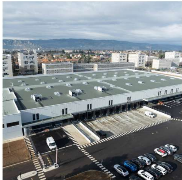
Bâtiment industriel 26 - Drôme