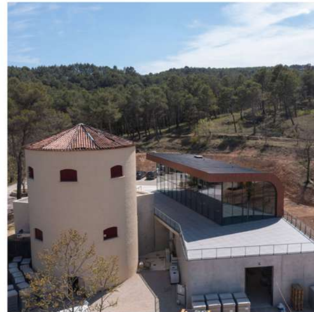
Cave de vinification 13 - Bouches-du-Rhône