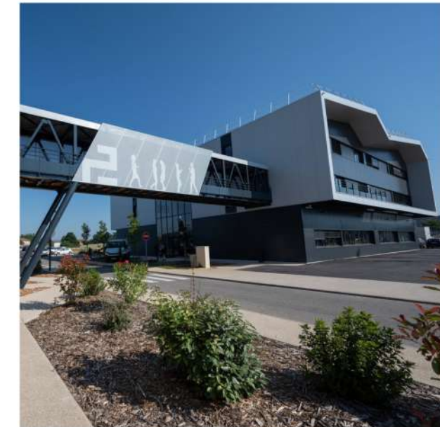
Bâtiment industriel 26 - Drôme