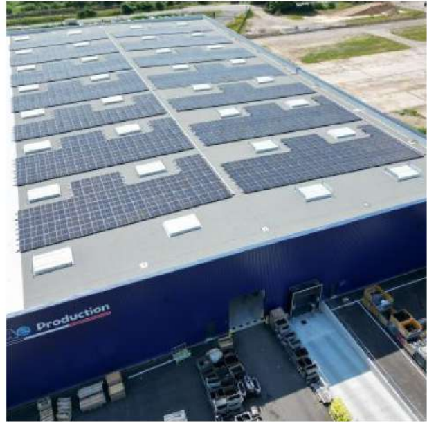
Bâtiment industriel 26 - Drôme