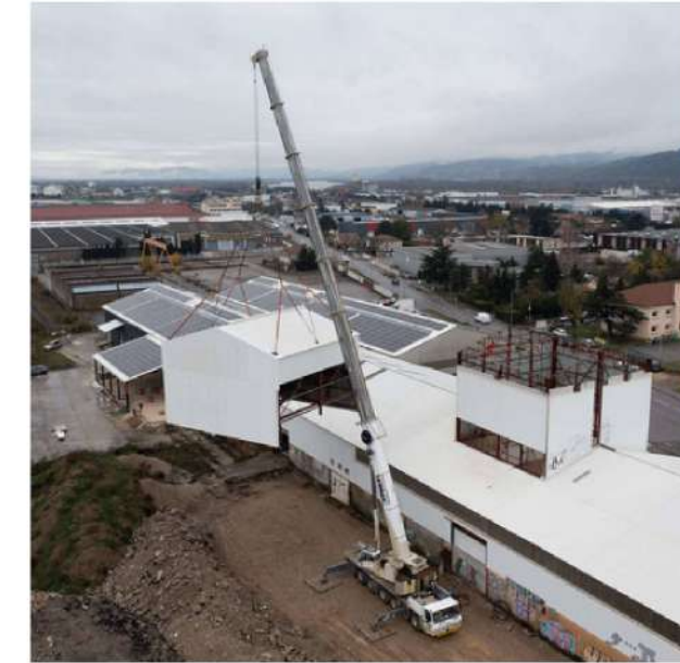
Bâtiment d'activité 26 - Drôme