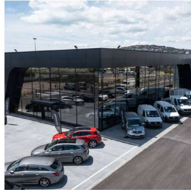
Bâtiment industriel 34 - Herault